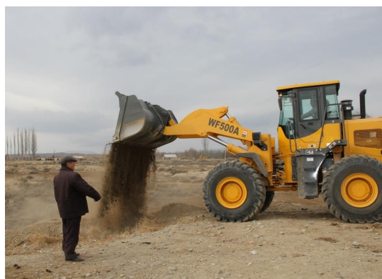
Фронтальный погрузчик в ОПП Улахол был куплен за 4 млн сом, - в процессе работы, 2016г.

- Большинство микропроектов ориентировано на охрану здоровья животных—это строительство купок, ям Беккари, приобретение аппаратов для стрижки овец, организацию пунктов искусственного осеменения, создание передвижного комплекса по предоставлению ветеринарных услуг. Также многие