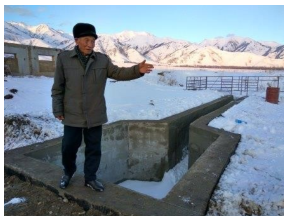
Купка в Тюпском районе.

- Некоторые Жайыт комитеты в официальном порядке отказались от первого гранта в пользу получения вместе со вторым грантом. Другие эффективно используют средства первого гранта и ожидают последующие.