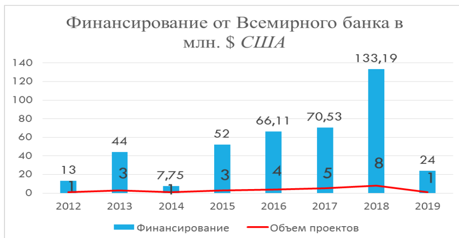
Рис.1 Общая сумма финансирования от Всемирного банка Кыргызстану (2012-2019)

новых проектов , около 100 млн.долларов США из которых являются грантовой помощью.