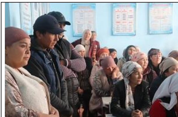
Рисунок 1. Жители село Могол-Коргон, Кенешского а.о., Базар-Коргонского района.

Успешные практики, такие как родительские собрания в школах, опыт показывает, что 77-82% матерей посещают собрания в школах. Активные женщины, участвовавшие на собраниях в дальнейшем, привлекались для проведения разъяснительной работы с женщинами о важности поднимаемых на информационных мероприятиях.