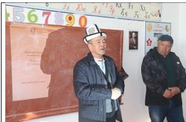
Рисунок 3. Специалист по ЧС Кызыл-Тууского а.о., Сузакского района.

Вовлечение глав сёл и представителей ОМСУ в подготовку мероприятий содействует созданию более инклюзивной среды.