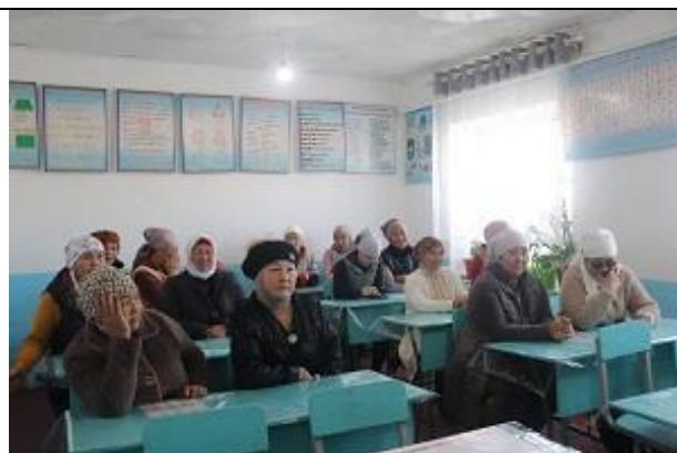
Рисунок 2. Жители село Мазар-Булак, Кок-Артского а.о., Сузакского района.

Вовлечение глав сёл и представителей ОМСУ в подготовку мероприятий содействует созданию более инклюзивной среды.