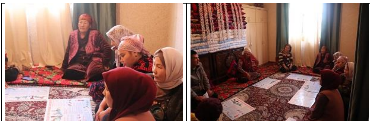
Рисунок 5. Жители село Сасык-Булак, Ырыского а.о., Сузакского района.

Этот подход позволил значительно увеличить участие женщин в мероприятиях. Проведение встреч у домов создало более дружественную и доверительную обстановку.