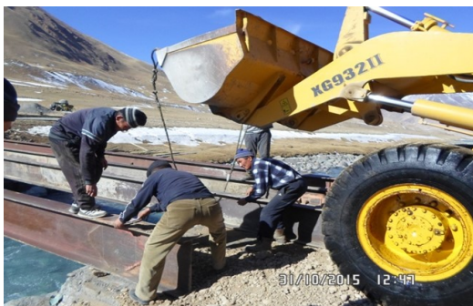
Микропроект в Барскоонском ОПП.

Так, в Кара-Ойском ОПП выполнен один микропроект “Реконструкция переездного моста на присельном пастбище Асык”. В Барскоонском ОПП - три: “Реконструкция моста через речку