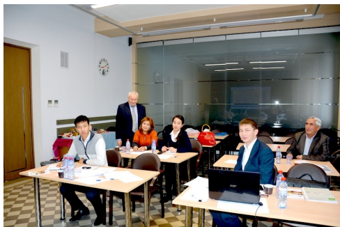
На одном из обучений в Москве.

Сотрудники Центра регистрации, сертификации ветеринарных лекарственных средств, кормов и кормовых добавок проходят различные курсы обучения, необходимые в их работе.