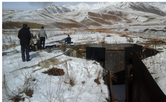
Микропроект в Эмгекчильском ОПП.

При этом 81 микропроект будет связан с решением проблем по охране здоровья животных, четыре – приобретение спецтехники, 24 - улучшение инфраструктуры пастбищ. Сегодня Проектом на сумму 17,5 млн сомов профинансирован 91 микропроект, предусматривающий закупку стригальных