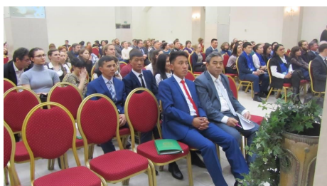
Фото с поездки в Москву.

Проект “Развитие животноводства и рынка”, оказавший финансовую помощь в организации поездки в Москву, поддерживает подобные инициативы. ▀